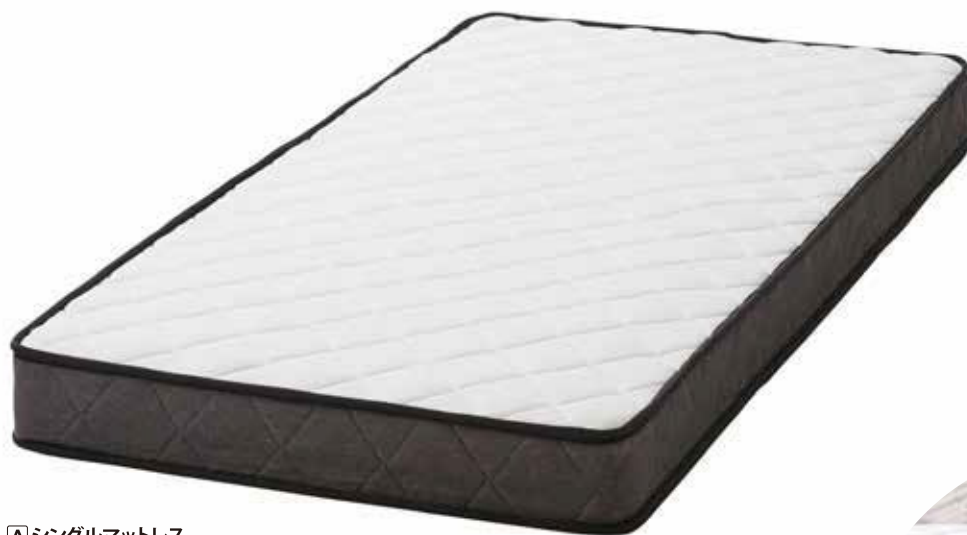
☐ シングルマットレス W97×L195×H11cm